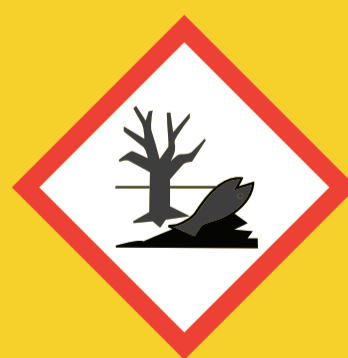
Peligro para el medio ambiente