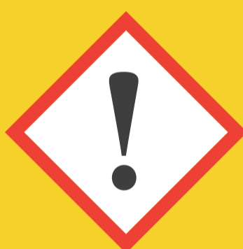
Peligro para la salud