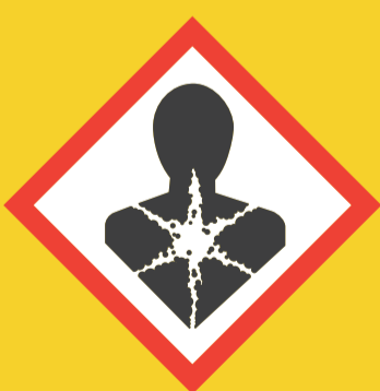
Peligro grave para la salud