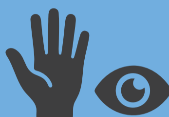
Dérmica Piel y mucosas