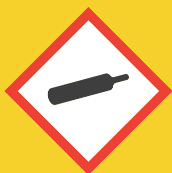
Gas a presión